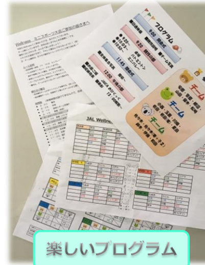
楽しいプログラム