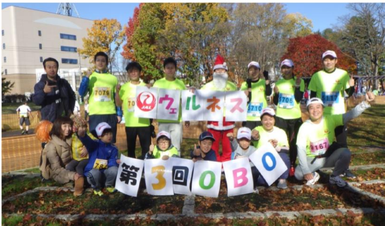
第3回 十勝フードバレーマラソン大会 2018.10.28