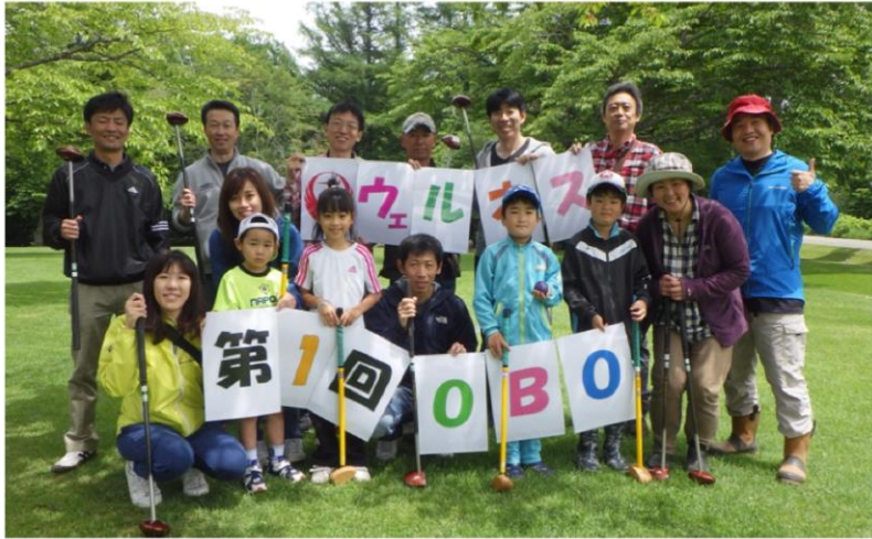
第1回 パークゴルフ大会 2018.06.10