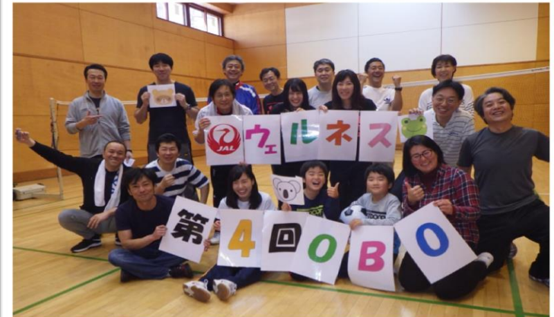
第4回 ミニスポーツ大会 2018.12.08