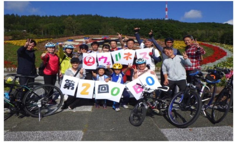
第2回 サイクリングツアー 2018.9.29