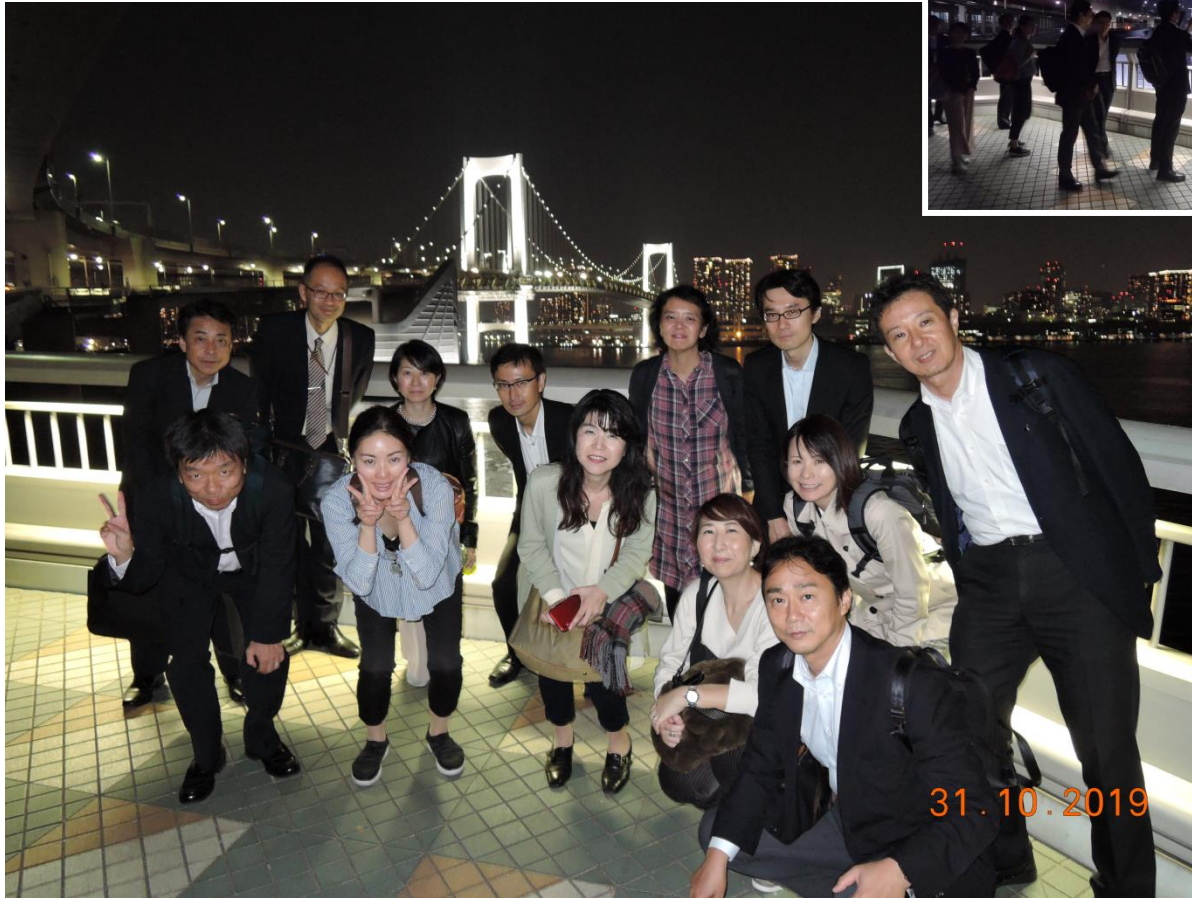
写真2 レインボーブリッジ歩道