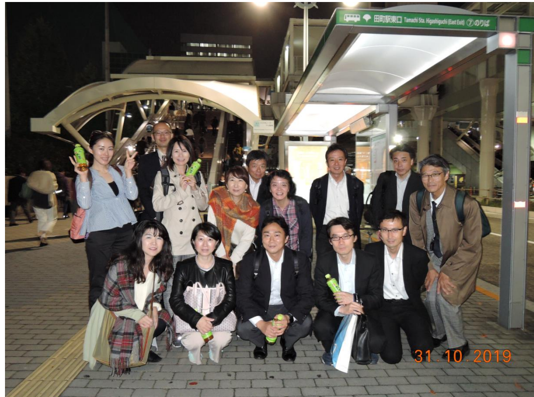
写真1 スタート地点 JR田町駅