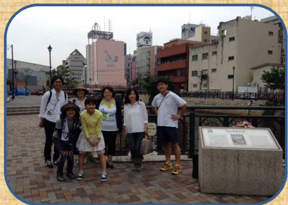
「納屋橋掘割跡」にて

最後にお茶を飲みながら反省会、その後解散となりました。 ご参加いただいた皆さま、ありがとうございました！