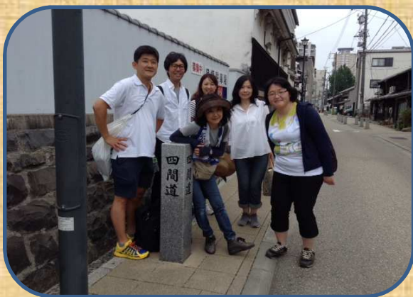
しけみち 「四間道」で一服

今回は、名古屋市の推奨コースを、参加者だけで歩きました。一般向けのウォーキングでないため、のんびりゆったり歩くことができました。400年前に江戸幕府がつくった運河がルーツの堀川沿いを歩きながら、所々で歴史の痕跡を見つけることができ、7km・1時間半のウォーキングは、あっという間に終わりました。