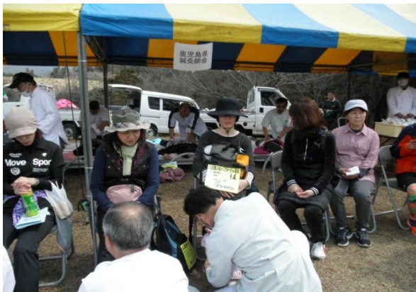
⑤ゴール後、マッサージで癒されています。