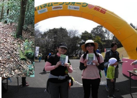
④ゴール 完歩賞拡大⇒