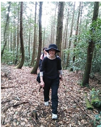
③美しい自然の中を歩きます