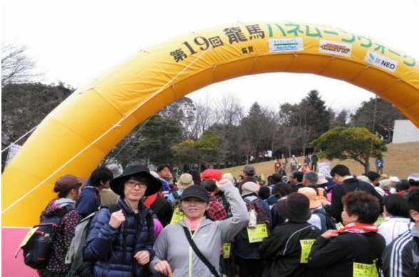
①参加者全員で“行っど、行っど、行っど！”*鹿児島弁の掛け声でスタート！！

全員が楽しく運動ができたので、今回の目的である参加者各々のウォーキングの継続についても充分期待ができるものとなった。