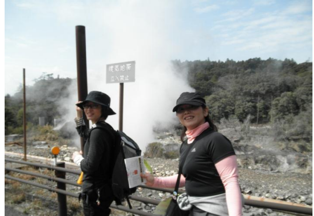
②温泉です。休憩したい。。。温泉入りたい！